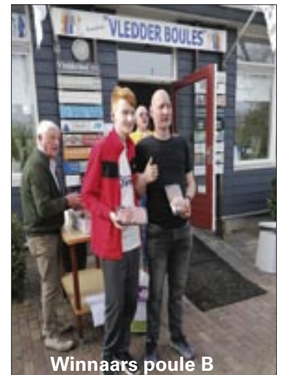
Winnaars poule B